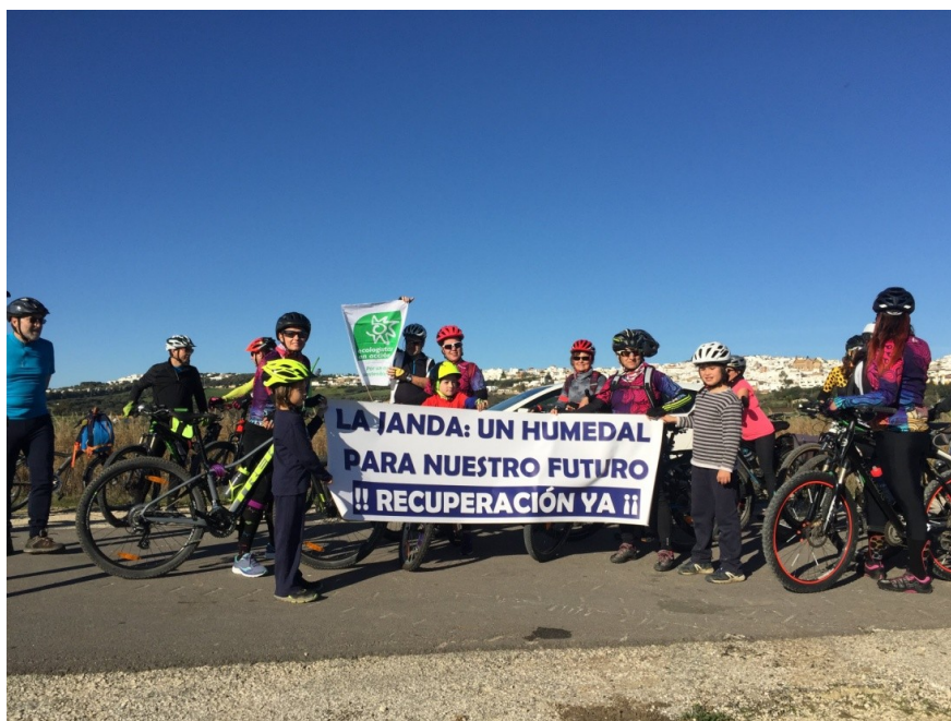
Marcha en bici por la Janda

El 3 de febrero, participamos en el recorrido por el antiguo humedal de la laguna de la Janda, por la recuperación del dominio público ocupado por fincas privadas, así como por una recuperación y restauración del humedal.