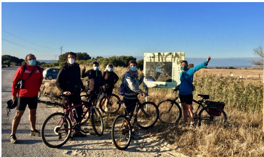
Excursión a la Janda en bici