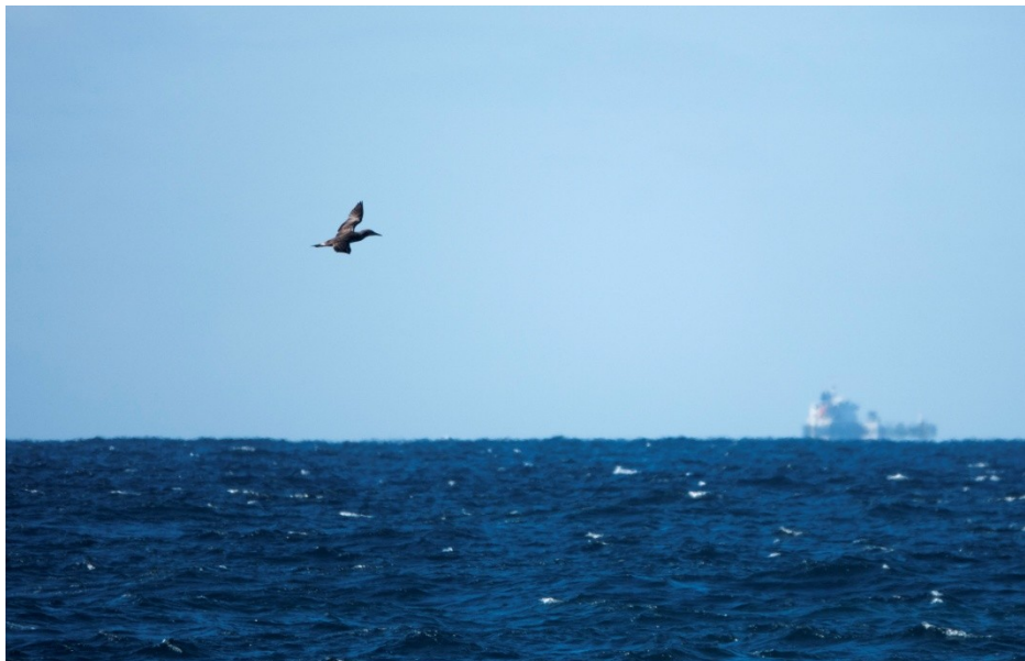
Alcatraz joven al Oeste