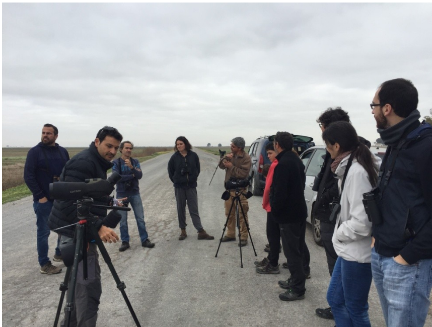
En el brazo del Este del Guadalquivir