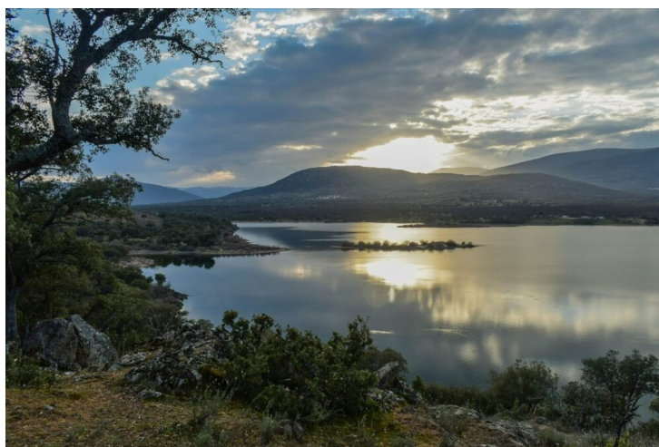
Embalse de Riosequillo y Valle del Lozoya.

Otros: Se realizó un inventario de las especies de fauna y flora detectadas en la actividad. Se espera darle continuidad en otras ocasiones para diseñar un calendario fenológico.