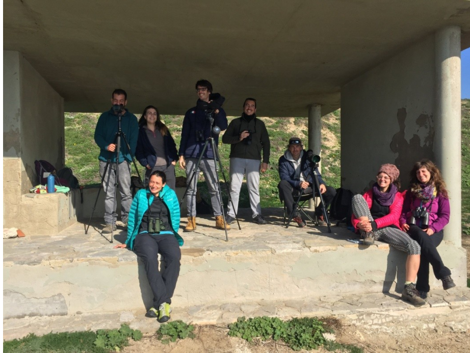
En el observatorio de la isla de Tarifa

Resultados anuales: más de 29 horas de observación. Más de 7.000 aves contadas, de 29 especies. 3 especies de cetáceos (9 individuos).