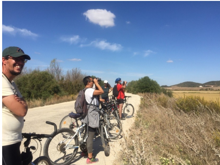
Observando aves en la Janda