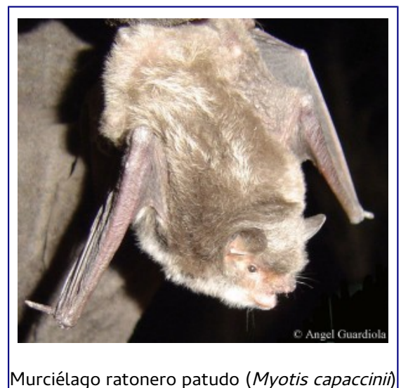
Murciélago ratonero patudo ( Myotis capaccinii )